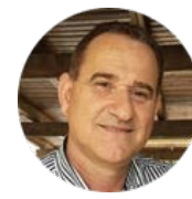
פרופ' גדעון קונדה